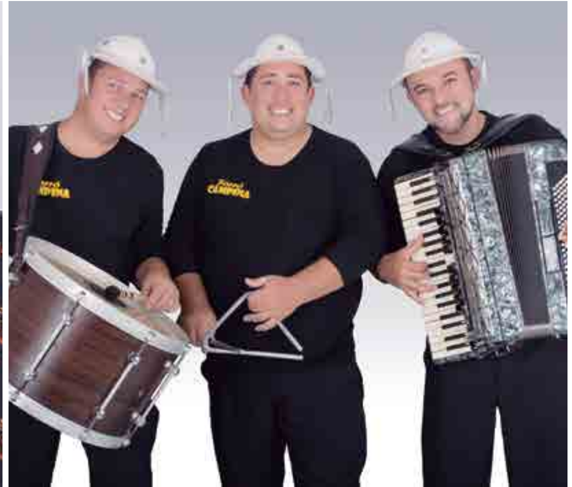
Da nova geração de forrozeiros, Os Fulano (E) e o trio Forró Campina (D) fazem show durante o evento, que começa nesta sexta-feira na Vila do Porto, no Centro Histórico da cidade, e continua no Hotel Tambaú, na orla da capital