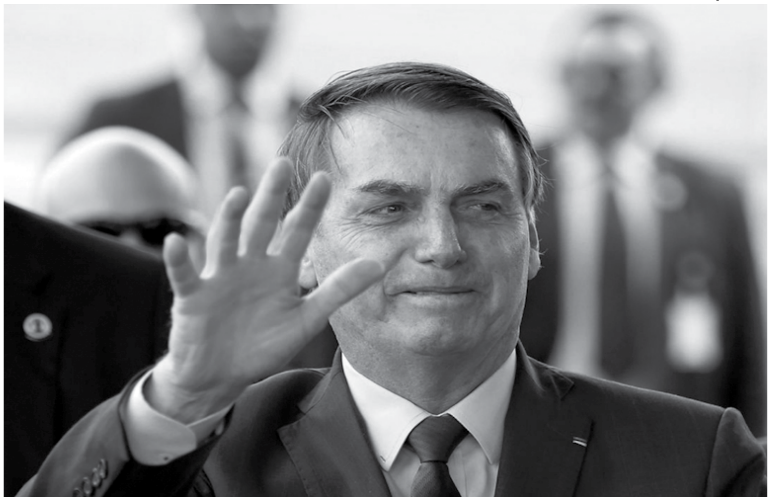
Bolsonaro disse que a contratação dos militares da reserva para o Instituto Nacional do Seguro Social será voluntária e sem haver convocação

Paralelamente, entre 2,1 mil e 2,5 mil funcionários do INSS que hoje trabalham no atendimento presencial serão remanejados para reforçar a análise dos process