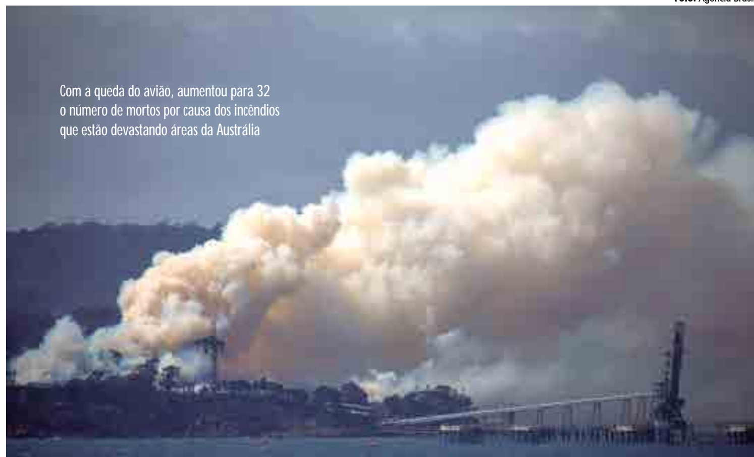
Com a queda do avião, aumentou para 32 o número de mortos por causa dos incêndios que estão devastando áreas da Austrália

Com a queda do avião, aumentou para 32 o número de mortos por causa dos incêndios. Os voos para o aeroporto de Camberra continuam condicionados às condições meteorológicas, já que grande parte da região está coberta por espessa nuvem de fumaça. Para as autoridades, o incêndio na área está “den-