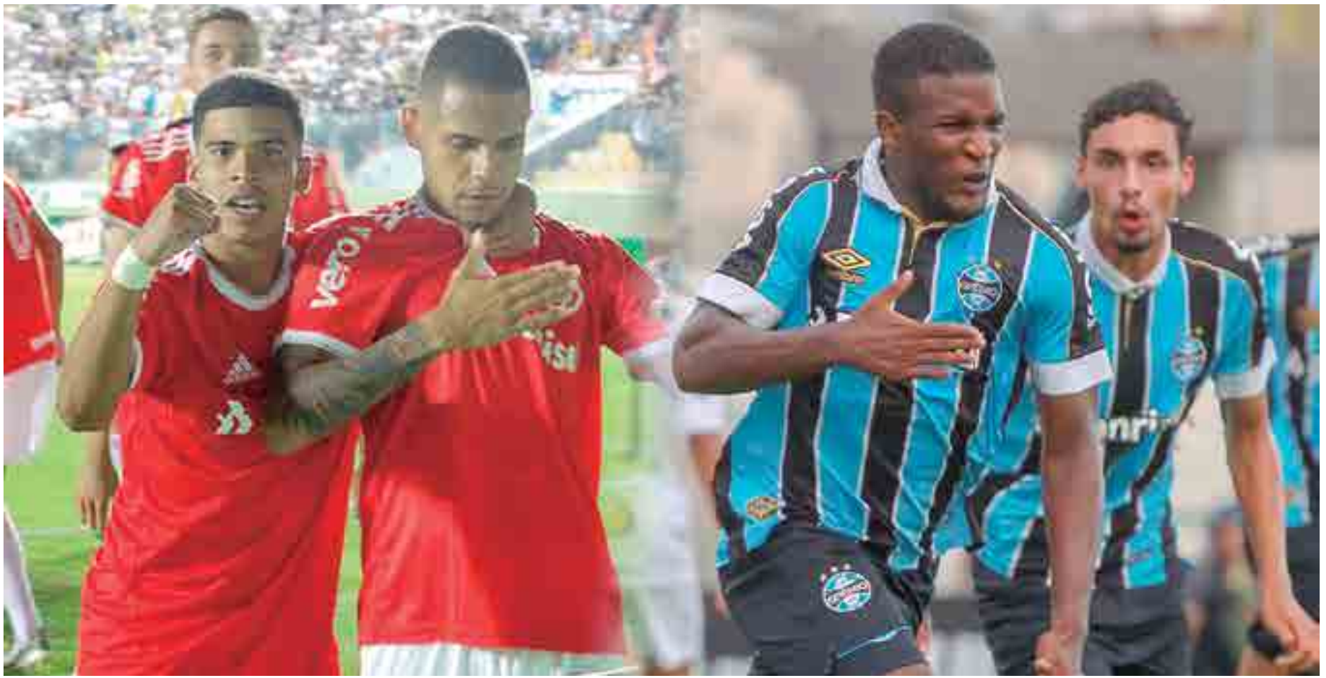
O futebol gaúcho mostrou força na Copa São Paulo e vai decidir o título neste sábado, numa final inédita na competição, principalmente por não ter nenhum paulista, agora pela quinta vez

Jogando na sede de Santa Bárbara d'Oeste, o Internacional terminou a primeira liderança seu grupo, depois de boas vitórias contra Confiança e Linense. No entanto, as fases finais não foram tão tranquilas para o