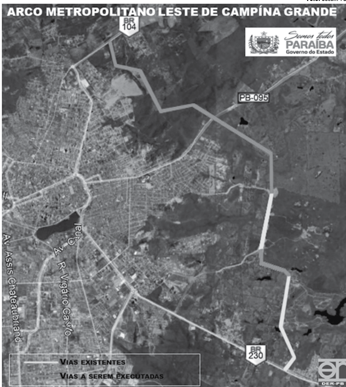
Uma das obras será a construção do Arco Metropolitano Leste de CG, que vai desafogar o trânsito no centro da cidade